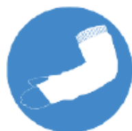
Manchettes anti-coupures (obligatoires sur certains sites)