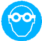
Lunettes de sécurité