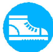
Chaussures de Sécurité couvrant intégralement le pied