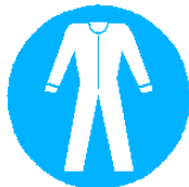
Pantalon et veste à manches longues